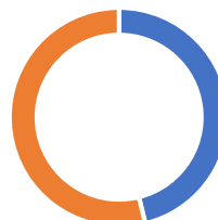
Loss and Damage Fund Board